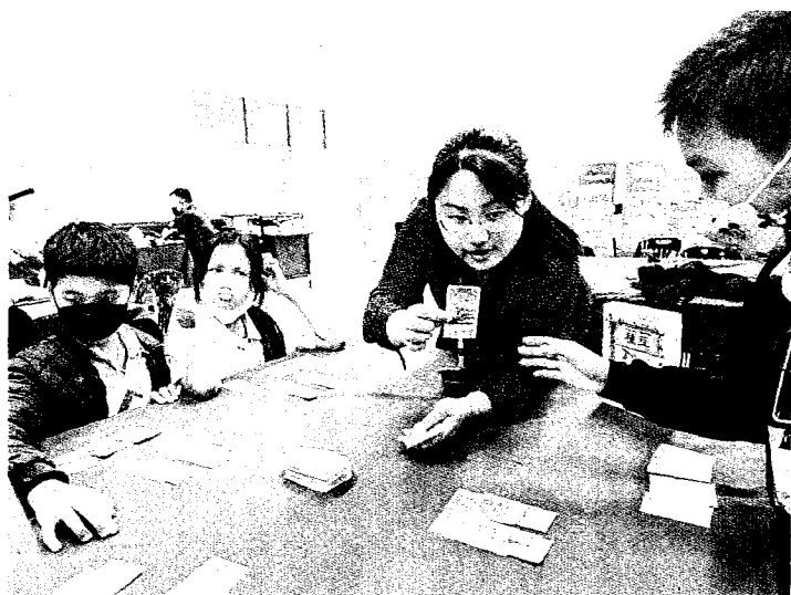
↑屏東大學師資生以桌遊結合公民50素養，參與泰國學校的教學活動。

記者王誌成／台北報導 教育部十五日指出，政府推動雙語政策，近年透過師資培育大學國外教育見習計畫，近日委託屏東大學辦理「教育部補助師資培育之大學辦理國外教育見習教育實習及國際史懷哲計畫」四場次的分享會，補助一千九百七十七名師資生前往超過二十個國家的中小學，開拓國際視野並將海外經驗帶回台灣。