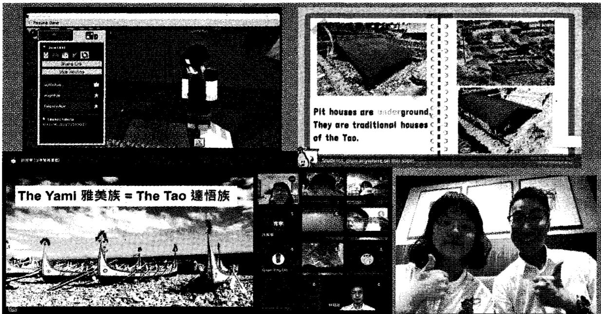
The Yami 雅美族 = The Tao 達悟族