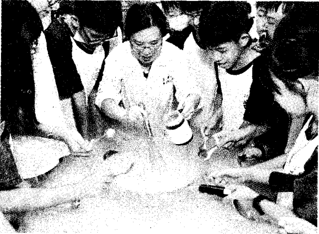
圖為嘉市玉山國中因應新課綱設計彈性課程，師長帶領學生探索分組體驗。

民進黨副總統參選人蕭美琴昨在高雄談到課綱議題表示，台灣教出來的孩子在世界上很有競爭力，應該要對自己有信心。她指出，課綱要活化，有更多現代工具，包含科技的工具及如何增進知識、如何面對世界等，看到台灣青年有好表現，要繼續為他們鼓勵。