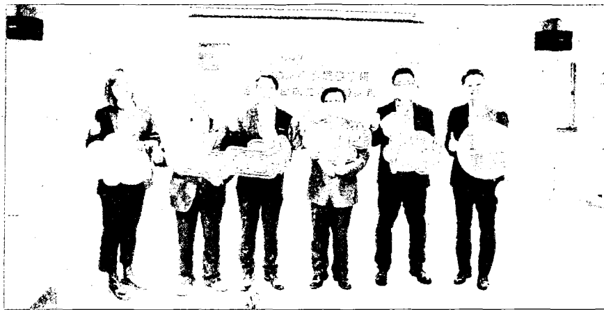
↑嘉藥結合產學各界成立「ESG永續發展產學研合作平台」，辦學特色獲肯定。