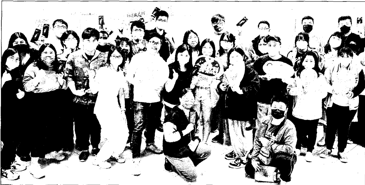
↑ 崑大連續十六年獲教育部補助「健康促進學校」 推動健康校園，表現深獲肯定。