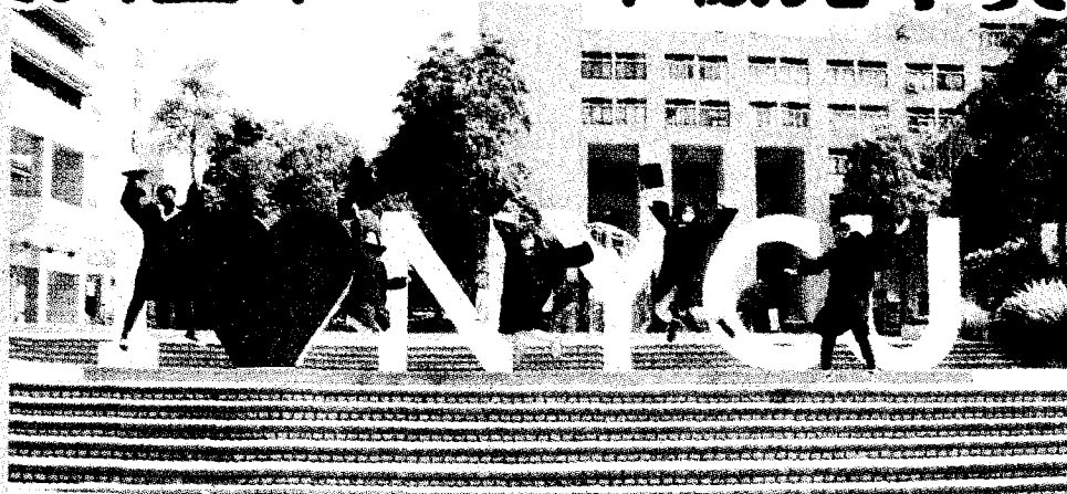
陽明交通大學18日宣布「博學大禮包」，自112學年度起實施博士班1、2年級免學費方案，吸引人才投入。

【台北訊】近年受到少子女化及產業變化影響，就讀博士班的人數降低，且休學率偏高。陽明交通大學宣布「博學大禮包」，自112學年度起實施博士班1、2年級免學費方案，吸引人才投入。