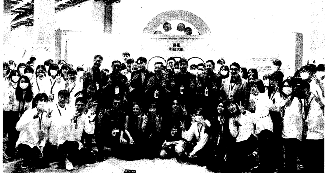
▶南臺科大數位設計學院112級畢業聯展在臺北新一代設計展開幕合影。

足患者步行時的穩定性，搭配電刺激及步距偵測數據化，讓患者從中了解自身情況，改善其行走成效；《肌力家+》是一款提升肌力、預防肌少症的「互動式肌力訓練套組」，透過簡單多樣化的運動器材組裝，搭配AR互動和肌少症檢測，達到健康老化、快樂生活的目的。