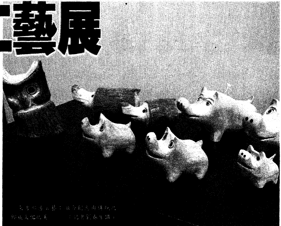
來吉部落工藝：融合創意與傳統鄒族文化之美

展覽中的作品包含木雕、油畫、陶藝、服飾和編織等多種形式，每一件作品都散發著藝術家對生活和自然的獨特感受。這些藝術作品不僅展現了來吉部落豐富的文化底蘊，還融入了創新的巧思，讓我們能夠感受到傳統文化和藝術的融合之美，也呈現了來吉部落的獨特文化特色。歡迎喜愛原住民文化的朋友們一起欣賞來吉工藝之美。