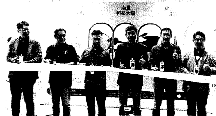
▲南臺科大數位設計學院112級畢業聯展在新一代設計展開幕剪綵。