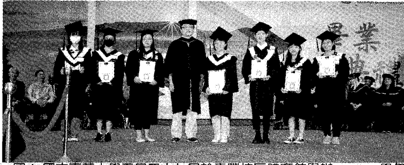
圖：國立東華大學五月二十七日於壽豐校區體育館舉辦一一一學年度畢業典禮。