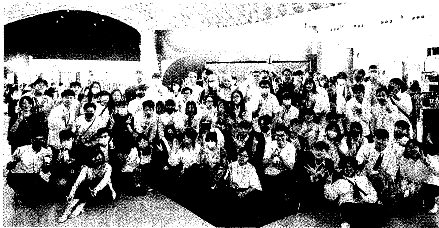
↑南台數位設計學院學生團隊在二〇二三放視大賞中，榮獲年度最佳學校獎。