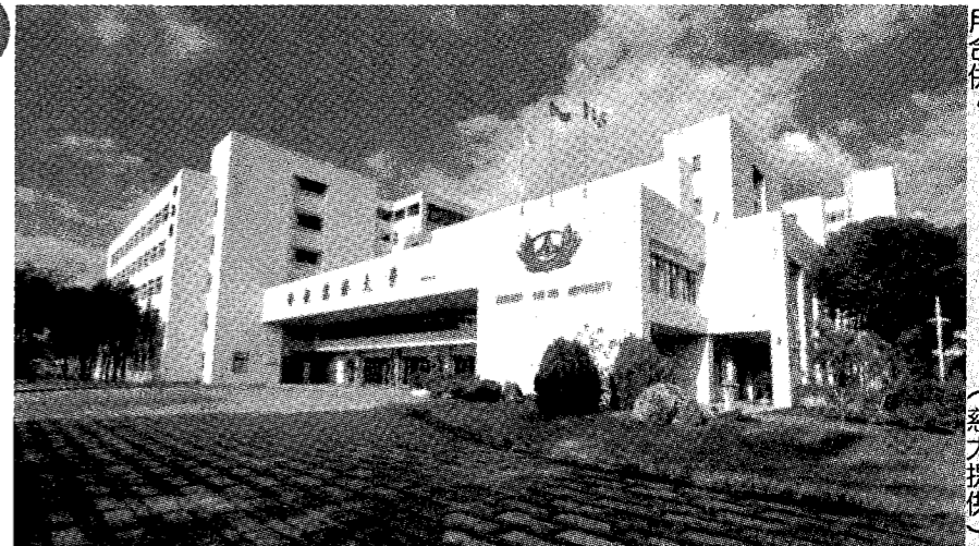
圖：花蓮慈濟大學和慈濟科大預計今年八月合併。

記者張小菁／報導 由佛教慈濟基金會職掌的慈濟大學、慈濟科大現正規畫兩校合併，今年四月初兩校合併計畫已獲得私校諮詢會初步通過，教育部發函學校，稱合併方向原則可行。但兩校盼於今年八月一日合併還有最後一哩路，私校諮詢會仍提出五點意見，要求學校最遲本月底回覆，力拚六月送「大學設立停辦變更及合併審議會」，審議通過後正式合併。