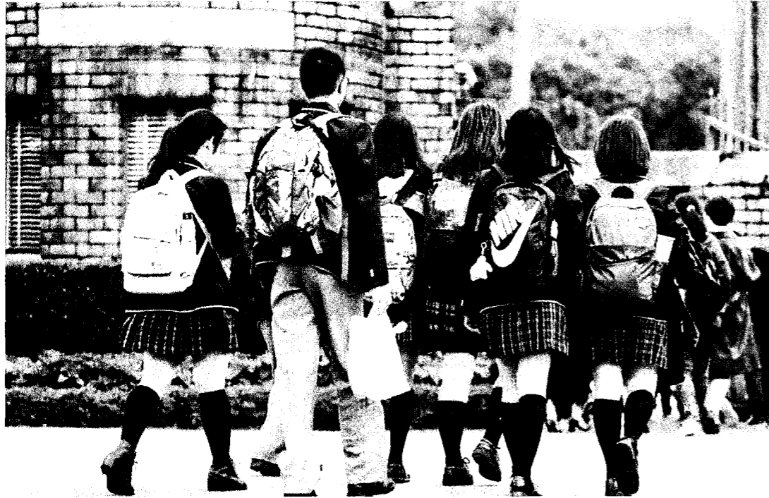
大學分發入學昨放榜，今年錄取率為百分之九十六點一四，較去年略降一點，台大醫學系參採五科目，最低錄取為二八三級分。