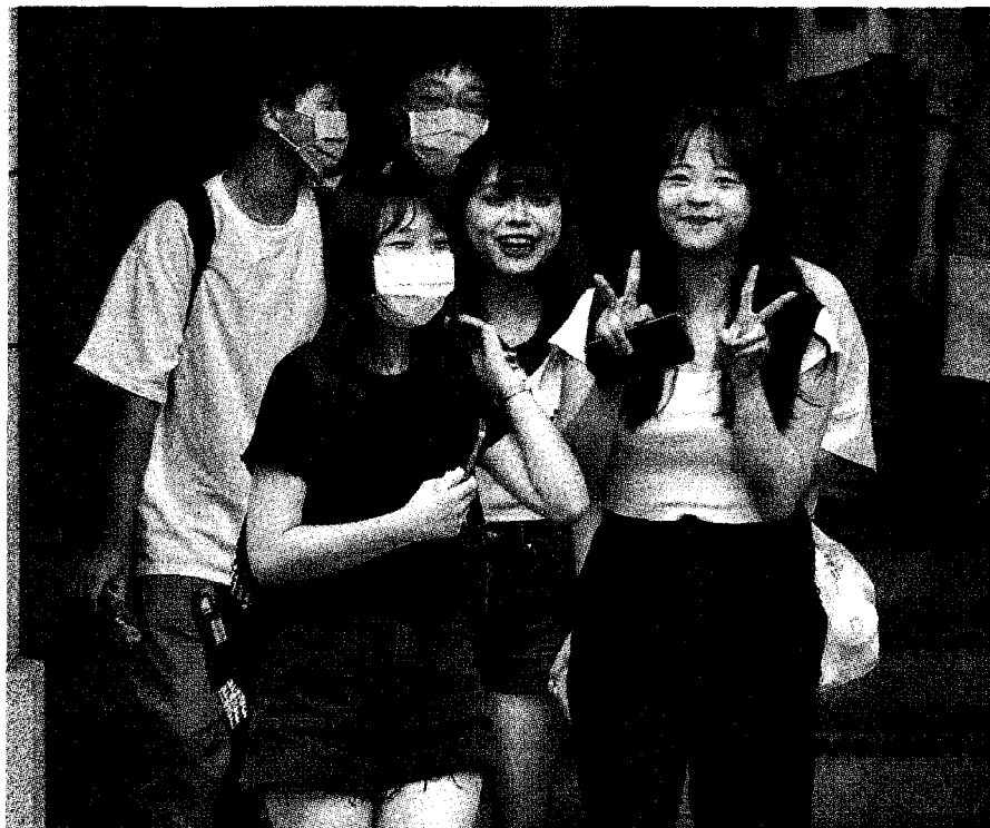
112學年度大學分發缺額率前6名學校