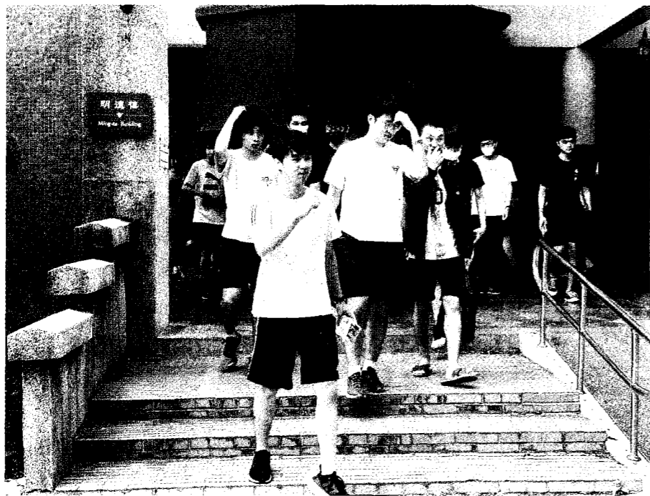
→ 大學分發十五日放榜。