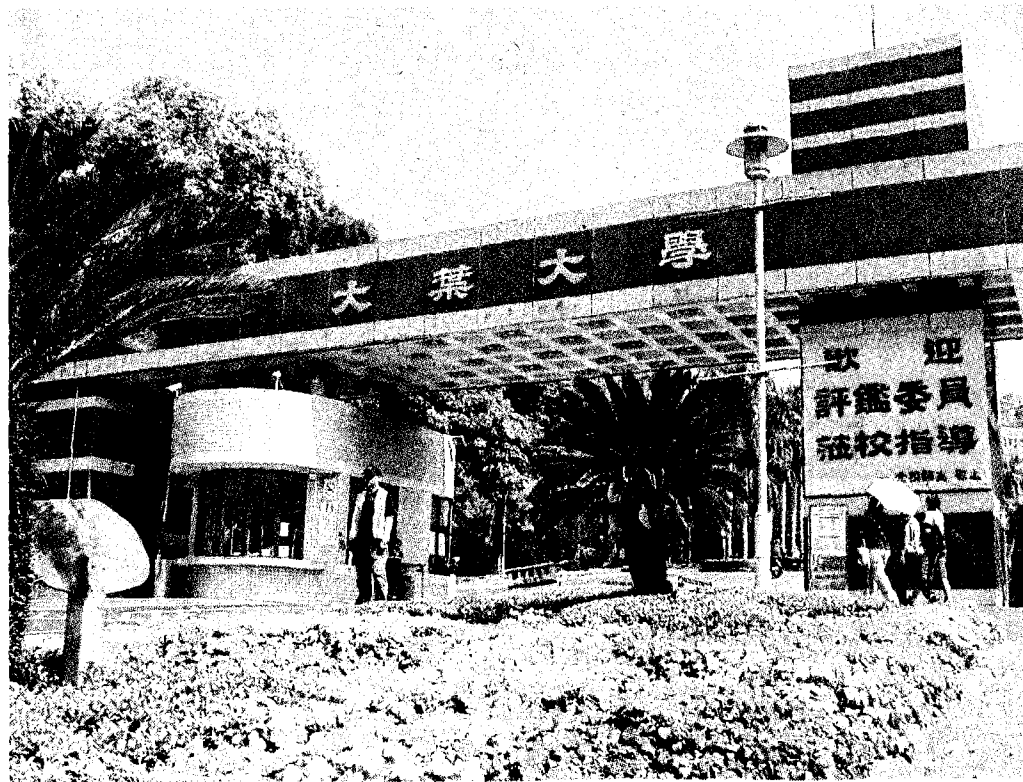
大葉大學分發入學缺額84.78%，校方表示，新學年已招千名新生，且加碼投資新增職能治療學系。