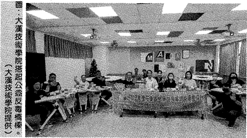
圖：大漢技術學院搭起公益反毒橋樑。