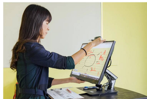
ViewSonic 客製化打造符合人體工學支架，讓老師可依照使用狀態快速調整、更舒適地教學。