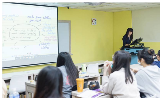
文藻外語大學運用 ViewSonic 智慧講台解決方案快速升級近百間互動教室。