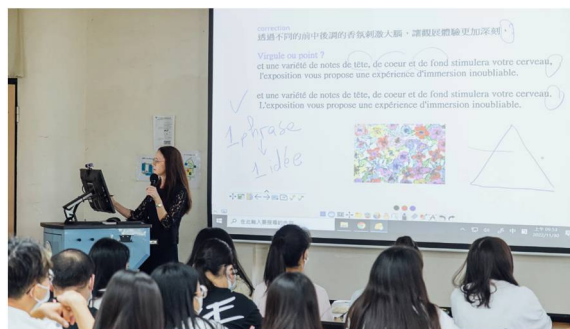
ViewSonic 智慧講台解決方案中 24 吋手寫觸控顯示器 ID2456，可一線連接教室原有投影機，大螢幕呈現 4K 高畫質影像。