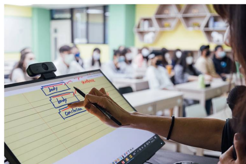
ViewSonic 智慧講台解決方案中 24 吋手寫觸控顯示器 ID2456，可一線連接教室原有投影機，大螢幕呈現 4K 高畫質影像。