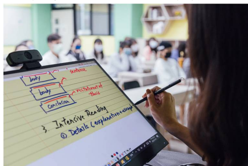
老師使用觸控筆自然書寫，精準呈現筆跡與字體大小、即時清楚標示重點，提高學生專注度。