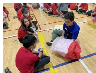
文藻外語大學實習生在越南胡志明臺灣學校，參與臺日韓三校「手作天燈」交流活動。