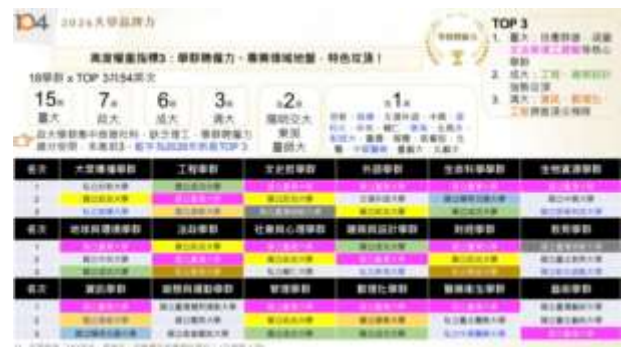
▲最佳學群獎